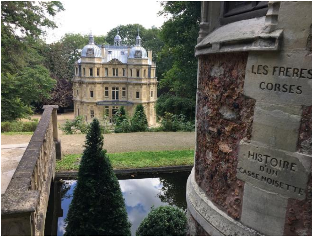
Le château de Monte-Cristo, vu depuis le château d'If, dans le domaine d'Alexandre Dumas, au Port-Marly, dans les Yvelines.

La manifestation « Jardins ouverts » organisée par la région Ile-de-France s'achèvera le dimanche 29 août. Parmi les visites, présentations ou animations proposées au cours de l'été : la visite des Jardins Renoir du Musée de Montmartre ; l'installation « Escalier(s) », de Téo Bétin, au Potager du roi, à Versailles ; « Les Graines Voyageuses », de Murielle Joubert, à la Maison-atelier Foujita (en Essonne) ; les visites guidées « La Nature à travers Champs » (sur réservation) dans le parc du château de Champs-sur-Marne (en Seine-et-Marne) ; la visite commentée du domaine du château d'Auvers (dans le Val-d'Oise) (le 22 août) ; la visite du parc du Peuple de l'herbe , à Carrières-sous-Poissy (dans les Yvelines) ; ou des concerts en plein air (toujours dans les Yvelines) de l' Ensemble Alla Francesca à la maison Jean-Monnet, à Bazoches-sur-Guyonne (le 21 août) ou au château de Monte-Cristo – chez Alexandre Dumas ! –, au Port-Marly (le 22 août).