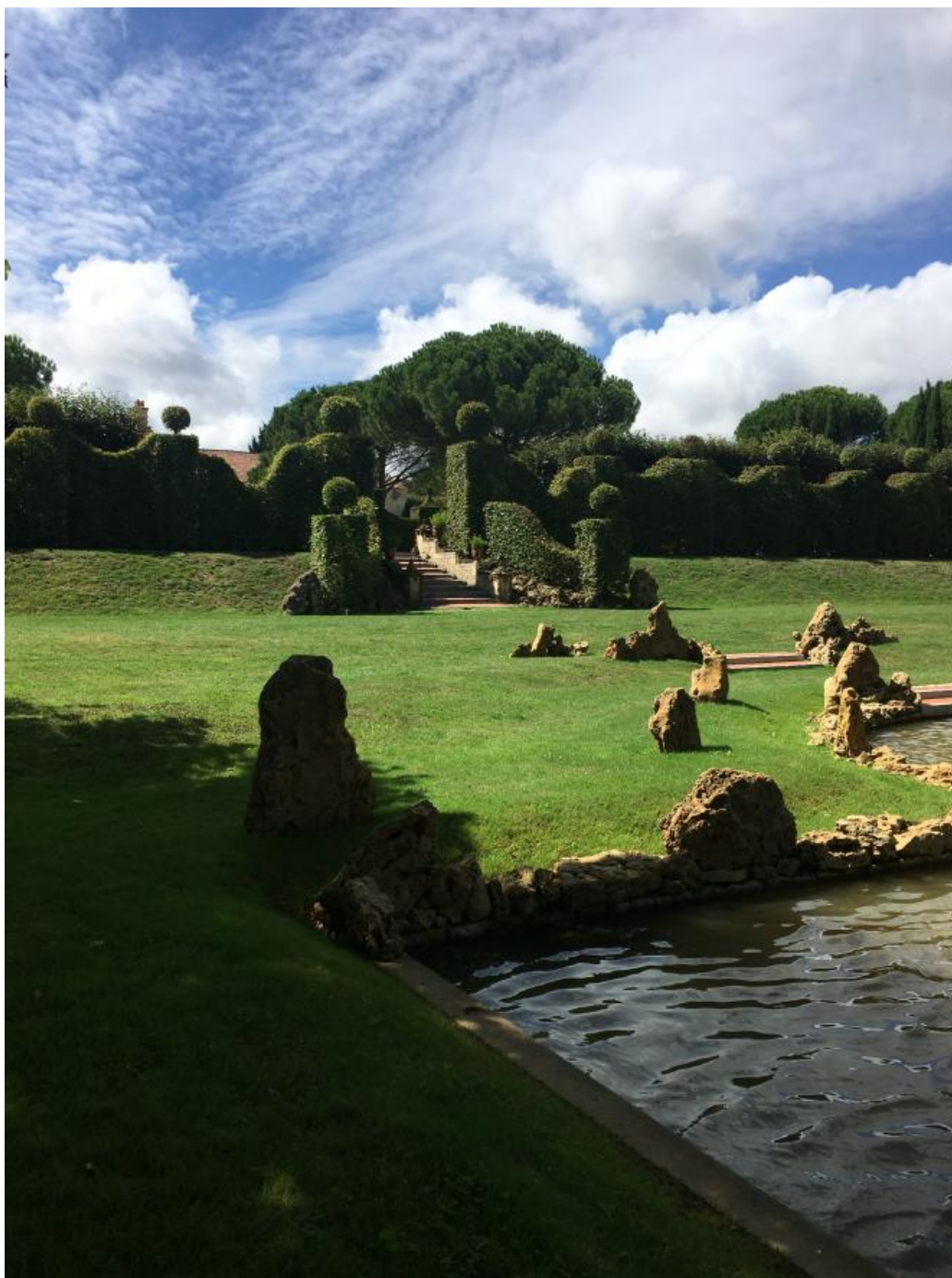
Topiaires et rocailles, dans les jardins de William Christie, à Thiré, en Vendée.

La passion conjointe du fondateur de l'ensemble baroque Les Arts florissants pour la musique des XVII e -XVIII e siècles et l'art des jardins s'est incarnée dans un festival musical, « Dans les jardins de William Christie ». La 10 e édition se déroulera du 21 au 28 août, dans ses jardins de Thiré, en Vendée, ouverts à la visite pour l'occasion. Au programme, entre autres : deux opéras de Haendel et de Purcell ( Partenope et The Indian Queen ), sur le miroir d'eau, des concerts et des promenades musicales, ainsi qu'une... création horticole, « Le Clos des piments ».