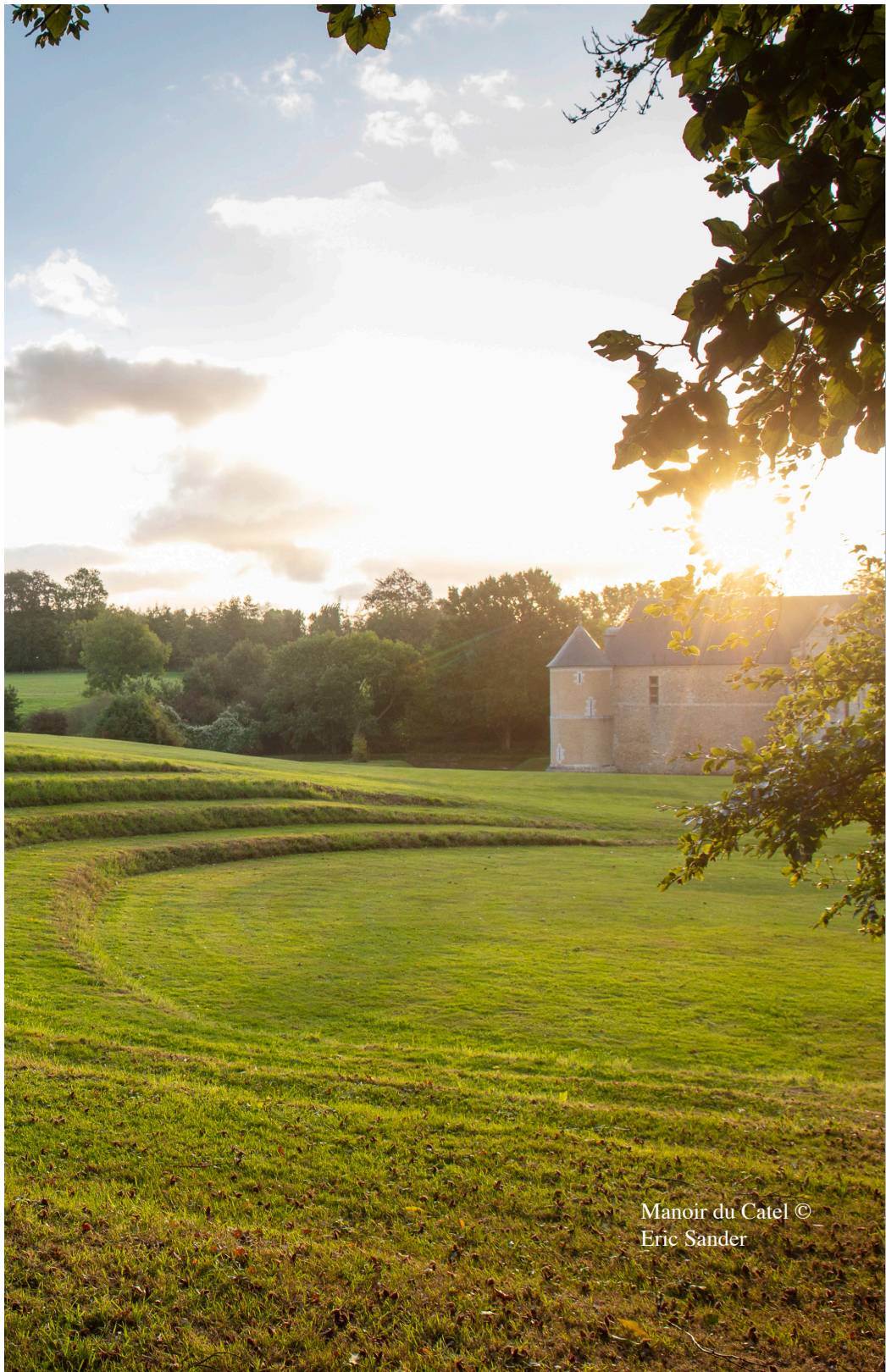
Manoir du Catel