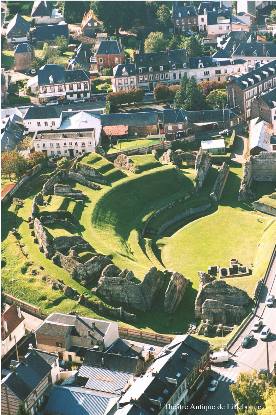
Théâtre Antique de Lillebonne