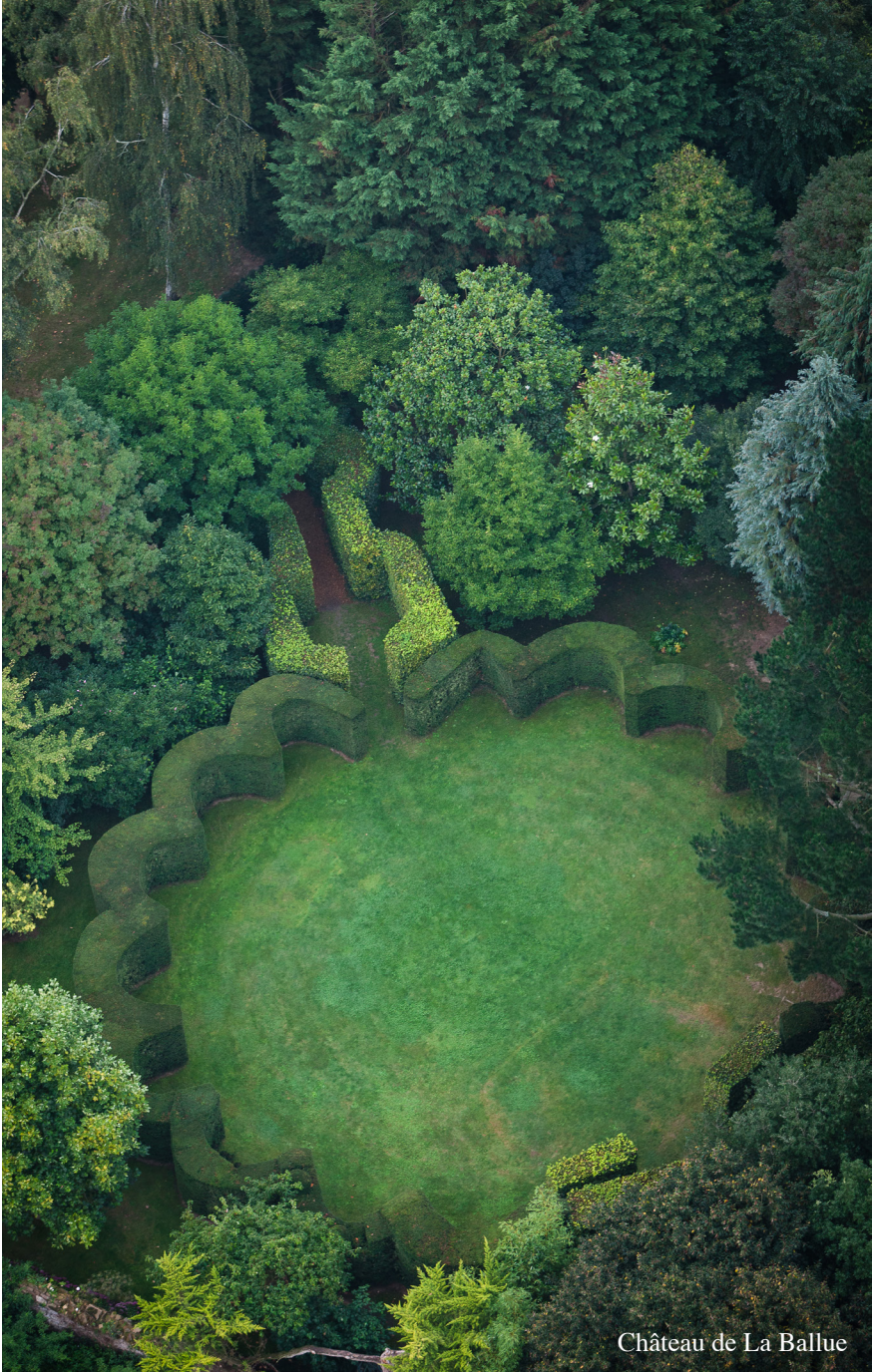
Château de La Ballue