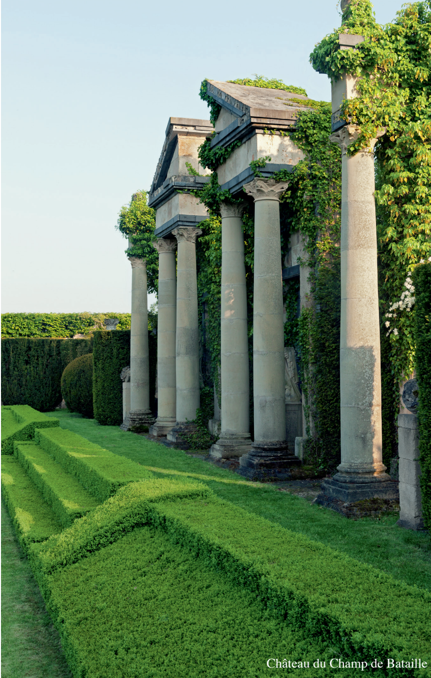
Château du Champ de Bataille