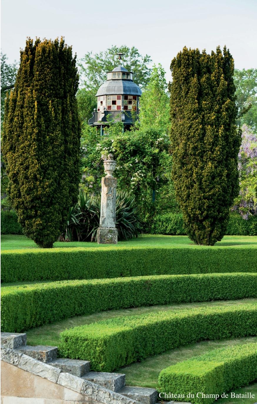
Château du Champ de Bataille