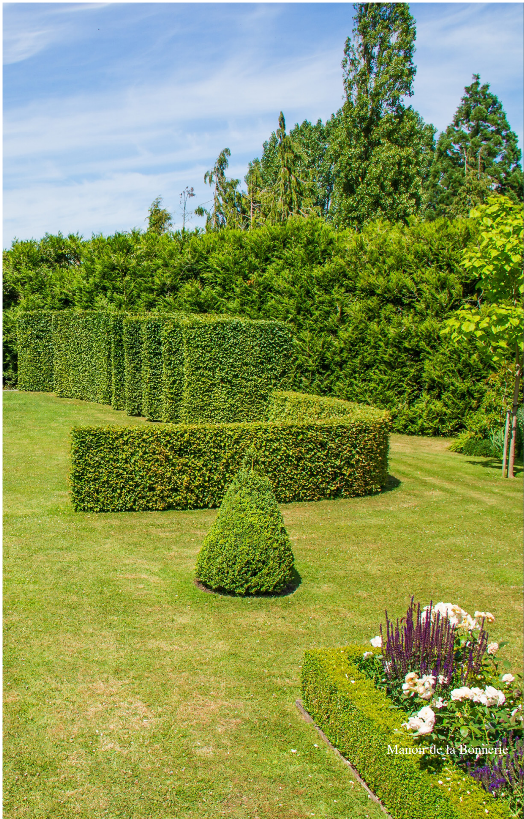
Manoir de la Bonnerie