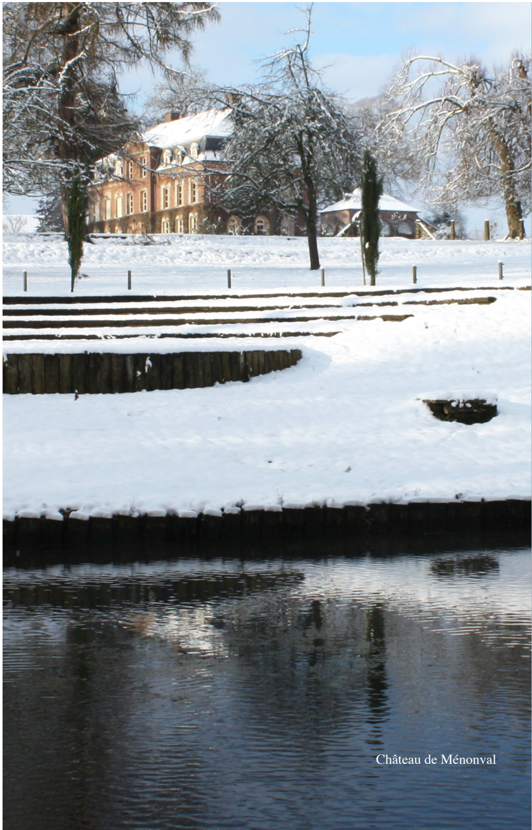
Château de Ménonval