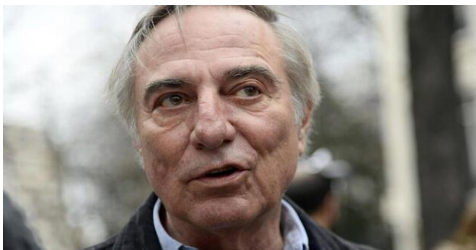
Allain Bougrain-Dubourg va parrainer le festival d'été les arts par nature.

Le domaine viticole de Vix, Prieuré la Chaume, lance la première édition d'un festival autour des arts et des sciences, du 17 juillet au 14 août. Il est parrainé par le président de la LPO.